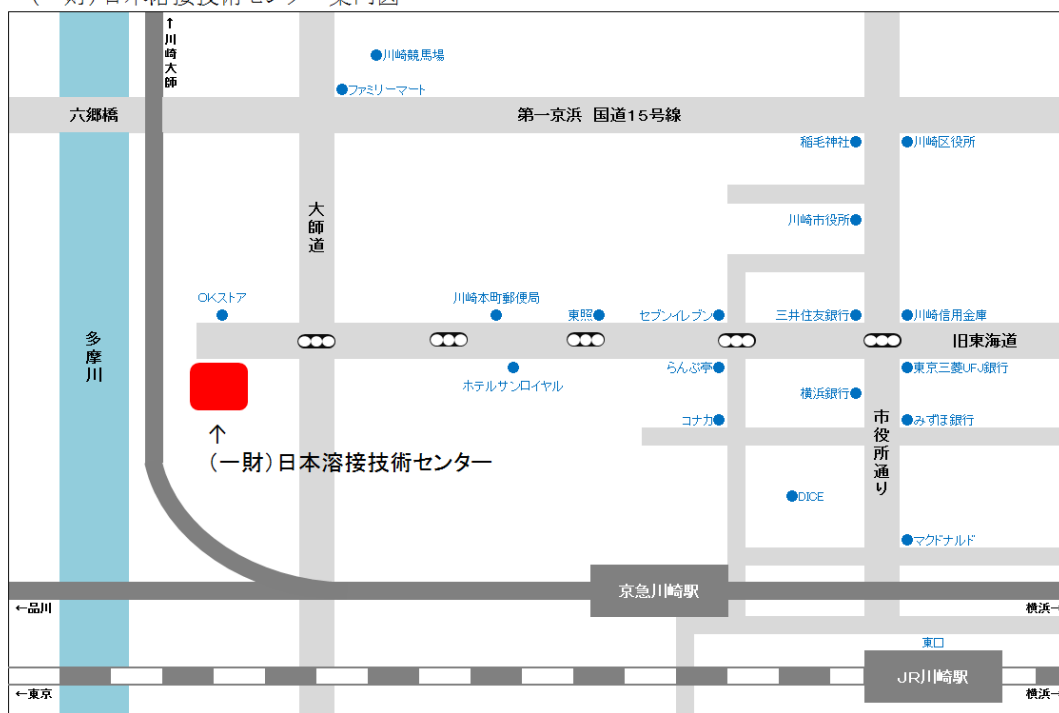
(一財)日本溶接技術センター案内図

※ 駐車場はありません。JR・京急をご利用ください。JR川崎駅東口より徒歩15分。京急川崎駅より徒歩10分。